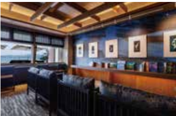
5F 海女ライブラリー