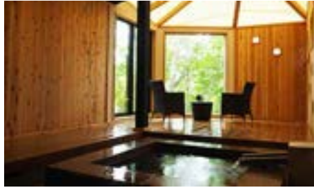
5F 離れ 貸切露天風呂「参の湯」