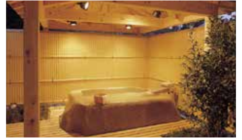
5F クラブ棟内 カラオケ付き貸切露天風呂「うらら・さんさん」