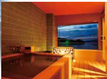
2階客室(バリアフリータイプ)