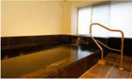
1F 貸切室内風呂「彩石の湯」