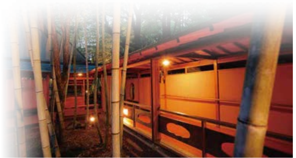
5F 「まろびね庵 つたい」